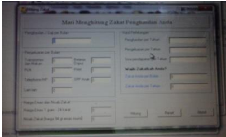
Gambar 2. Kalkulator Zakat