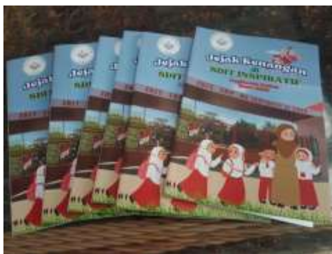
Gambar 3. Buku Antologi Angkatan Kedua SDIT Inspiratif

Setelah proses editing, layout dan pembuatan cover selesai, berikutnya menconvert seluruh draft buku menjadi bentuk file pdf. Tahap akhir dari pembuatan buku adalah publishing atau mencetak buku. Proses mencetak buku dilakukan di percetakan milik yayasan sekolah. Buku ini telah diluncurkan saat kelulusan sekolah disaksikan oleh seluruh anak-anak, orangtua murid, kepala sekolah, ketua Yayasan dan pengawas sekolah. Contoh bentuk buku yang telah dicetak, kami tampilkan di gambar 3 berikut.