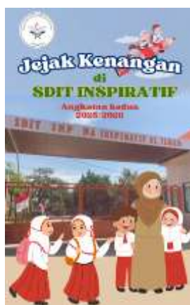
Gambar 3. Cover Buku Antologi Angkatan Kedua SDIT Inspiratif

Proses selanjutnya adalah pembuatan cover buku. Proses pembuatan menggunakan software Canva. Selanjutnya cover dimasukkan dalam software latex sehingga menjadi buku yang utuh. Gambar cover buku seperti ditunjukkan pada gambar 3.